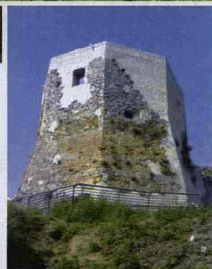
Nella foto grande, il mulino di Montignoso, oggi trasformato in relais. Qui sopra, il borgo tipico di Fivizzano e, a sinistra, il castello Aghinolfi.